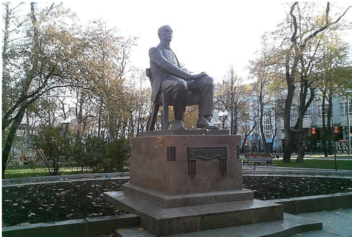
Памятник С.В. Рахманинову в Москве